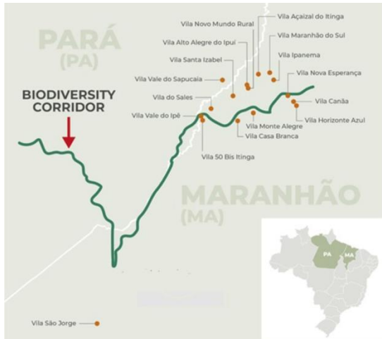
Imagem1. Corredor de Biodiversidade da Amazônia.

O Corredor de Biodiversidade da Amazônia é um corredor ecológico proposto pela empresa Suzano, que visa conectar importantes fragmentos de vegetação nativa entre o Pará e o Maranhão, permitindo o trânsito da fauna silvestre, o fluxo gênico entre espécies vegetais e a conservação da biodiversidade. Do total de 9.000 hectares que compõem o traçado do Corredor de Biodiversidade da Amazônia, cerca de 840 hectares atravessam 5 projetos de Assentamento (P.A.) que fazem parte da área de abrangência do Projeto no